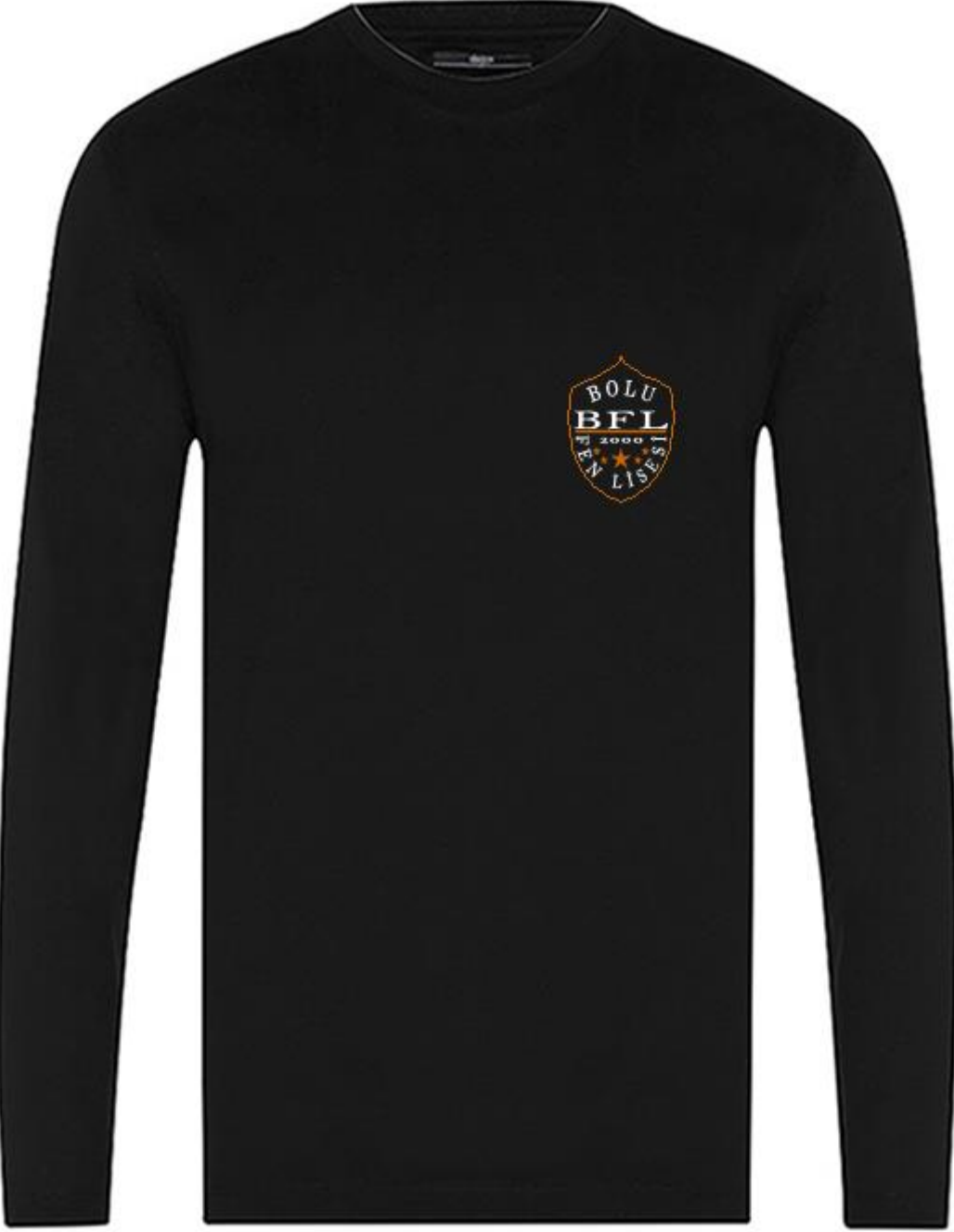
BİSİKLET YAKA UZUN KOL