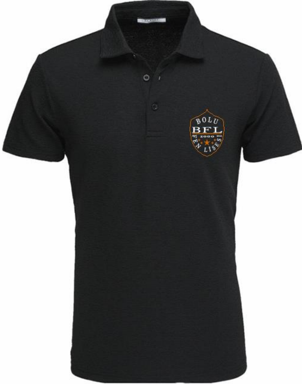
POLO YAKA KISA KOL