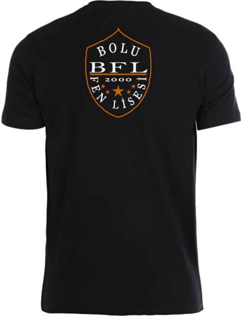
BİSİKLET YAKA KISA KOL